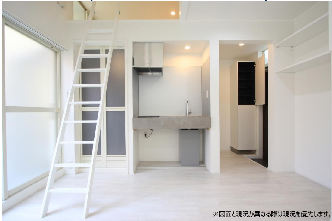
※図面と現況が異なる際は現況を優先します。